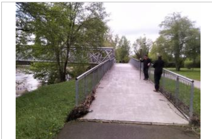
Vue du site - auteur : SPC GAD

Coordonnées WGS84 : X: 0.66240750 / Y: 45.18881700