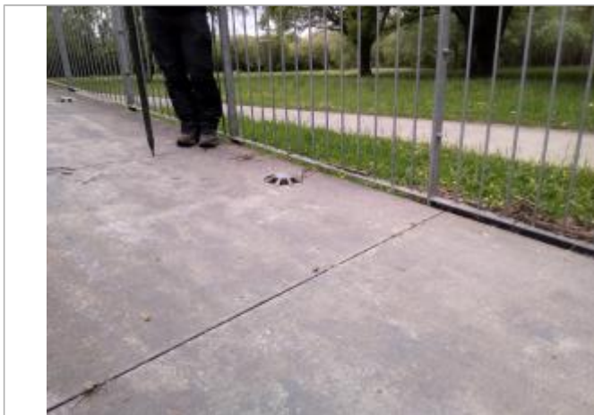
Vue de la laisse - auteur SPC GAD