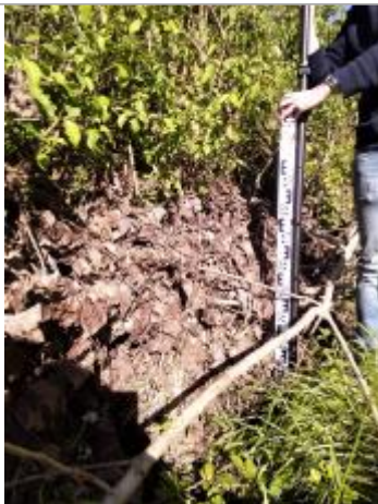
Vue de la laisse - auteur SPC GAD

Altitude calculée de l'eau (en m) : 54.087