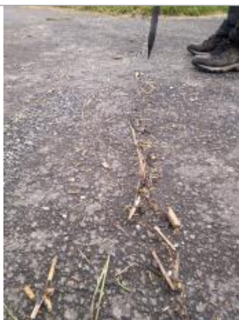
Vue de la laisse - auteur SPC GAD