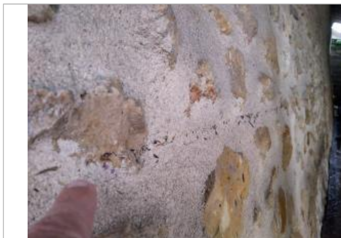
Vue de la laisse - auteur SPC GAD