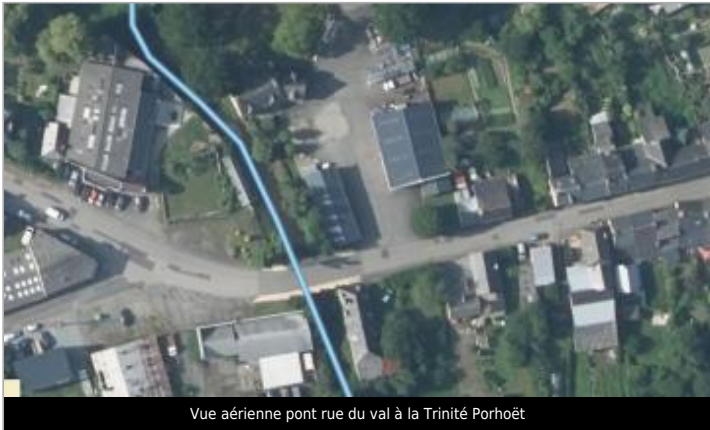
Vue aérienne pont rue du val à la Trinité Porhoët