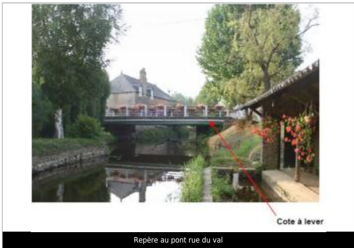
Repère au pont rue du val