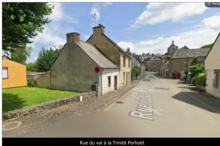
Rue du val à la Trinité Porhoët

Coordonnées WGS84 : X: -2.55044878 / Y: 48.09763920