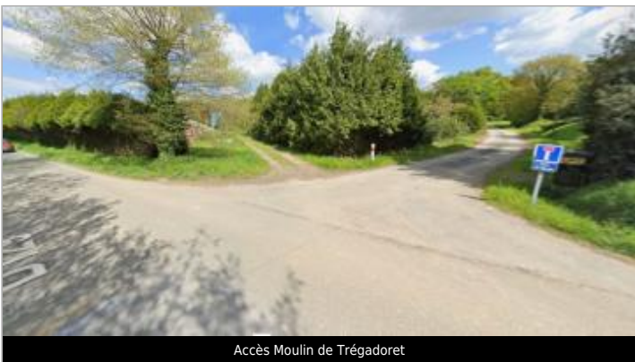
Accès Moulin de Trégadoret

GÉOLOCALISATION Coordonnées WGS84 : X: -2.36240316 / Y: 47.99432700 Coordonnées RGF93 (Lambert 93) X: 300338.73 / Y: 6779569.17 Coordonnées RGF93 (ETRS89) : X: -2.3624032 / Y: 47.994327 Code Hydro: J83-0310 Rive de référence: Non renseigné