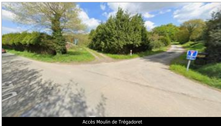
Accès Moulin de Trégadoret