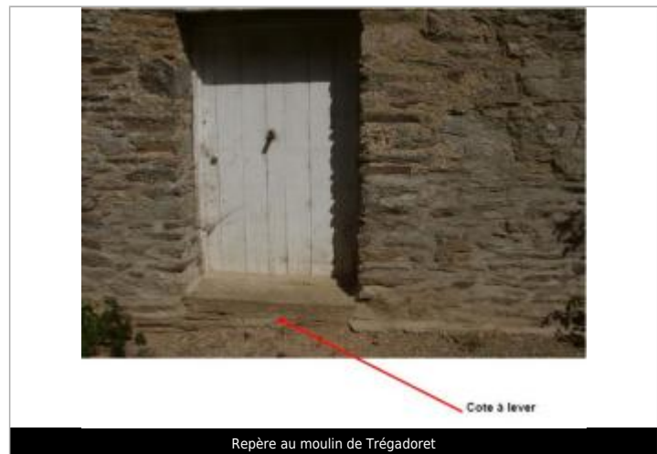
Repère au moulin de Trégadoret