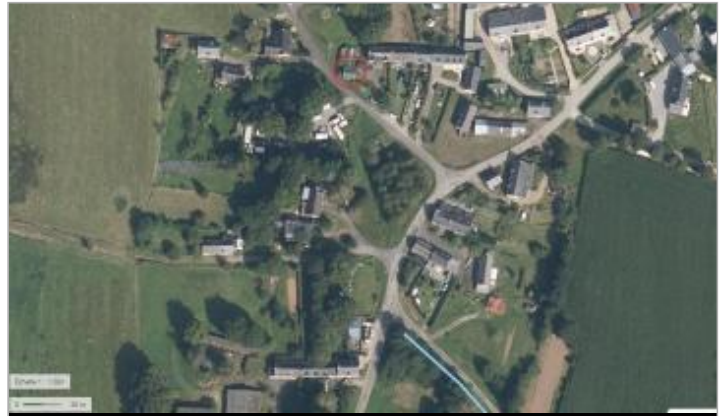
Habitation Lieu-dit la Tronçonnais à Saint-Congard