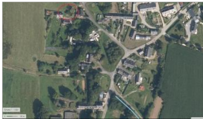
Habitation Lieu-dit la Tronçonnais à Saint-Congard

Coordonnées WGS84 : X: -2.32759316 / Y: 47.76284830