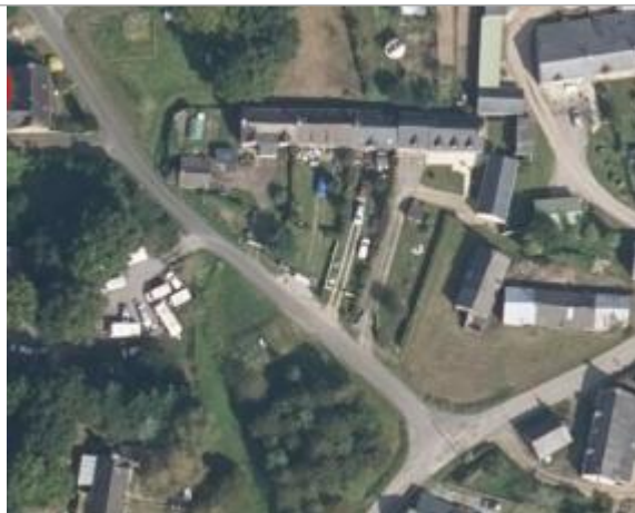
Habitation Lieu-dit la Tronçonnais à Saint-Congard