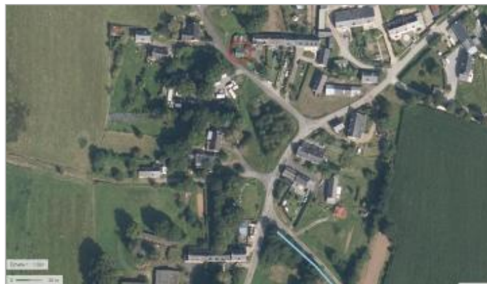
Habitation Lieu-dit la Tronçonnais à Saint-Congard