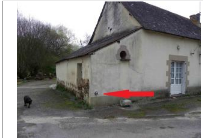
bâtiment à coté du moulin de Fô en 2011

Coordonnées WGS84 : X: -2.39988321 / Y: 47.78167230