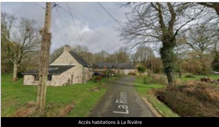
Accès habitations à La Rivière