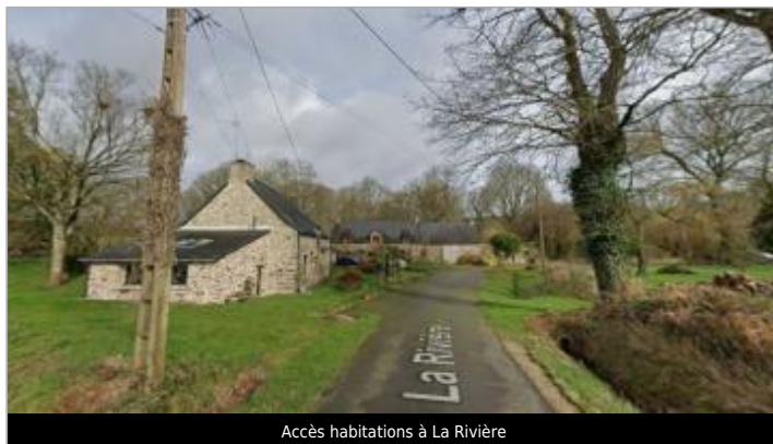
Accès habitations à La Rivière

Coordonnées WGS84 : X: -2.40796881 / Y: 47.78712950