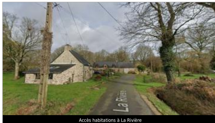
Accès habitations à La Rivière

GÉOLOCALISATION Coordonnées WGS84 : X: -2.40796881 / Y: 47.78712950 Coordonnées RGF93 (Lambert 93) X: 295372.46 / Y: 6756832.05 Coordonnées RGF93 (ETRS89) : X: -2.4079688 / Y: 47.7871295 Code Hydro: J84-0300 Rive de référence: Droite