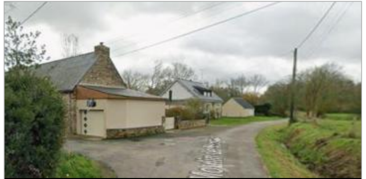
Accès habitations lieu-dit Georgelais