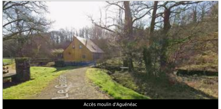
Accès moulin d'Aguénéac

GÉOLOCALISATION Coordonnées WGS84 : X: -2.55655346 / Y: 47.79704250 Coordonnées RGF93 (Lambert 93) X: 284350.81 / Y: 6758702.58 Coordonnées RGF93 (ETRS89) : X: -2.5565535 / Y: 47.7970425 Code Hydro: J84-0300 Rive de référence: