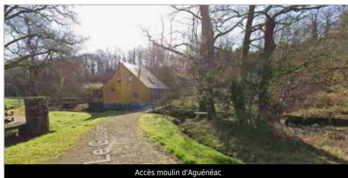
Accès moulin d'Aguénéac

GÉOLOCALISATION Coordonnées WGS84 : X: -2.55655346 / Y: 47.79704250 Coordonnées RGF93 (Lambert 93) X: 284350.81 / Y: 6758702.58 Coordonnées RGF93 (ETRS89) : X: -2.5565535 / Y: 47.7970425 Code Hydro: J84-0300 Rive de référence: