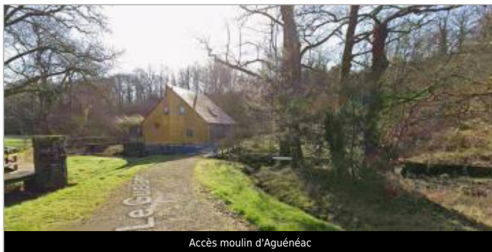
Accès moulin d'Aguénéac