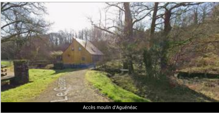
Accès moulin d'Aguénéac

GÉOLOCALISATION Coordonnées WGS84 : X: -2.55655346 / Y: 47.79704250 Coordonnées RGF93 (Lambert 93) X: 284350.81 / Y: 6758702.58 Coordonnées RGF93 (ETRS89) : X: -2.5565535 / Y: 47.7970425 Code Hydro: J84-0300 Rive de référence: