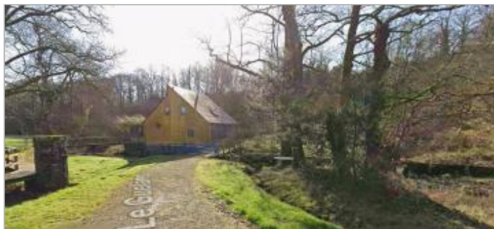
Accès moulin d'Aguénéac

Coordonnées WGS84 : X: -2.55655346 / Y: 47.79704250