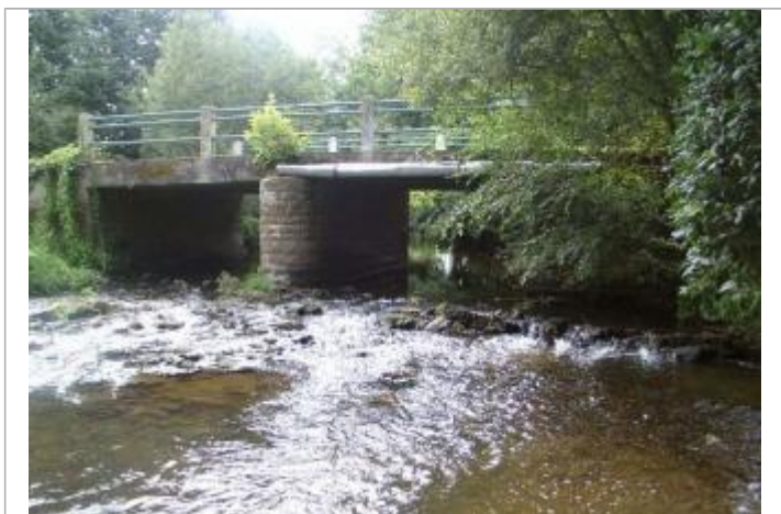
Pont route de Letiernan