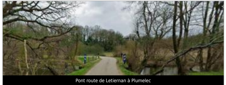
Pont route de Letiernan à Plumelec