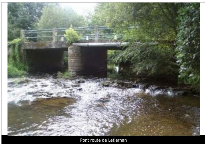
Pont route de Letiernan