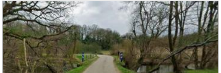
Pont route de Letiernan à Plumelec