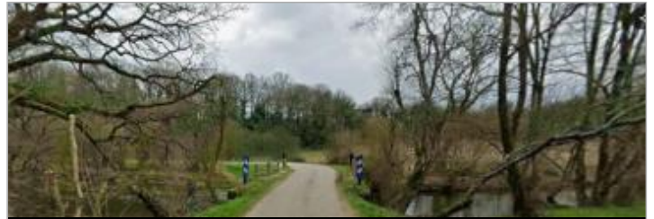
Pont route de Letiernan à Plumelec