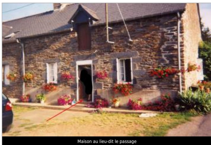
Maison au lieu-dit le passage

Altitude calculée de l'eau (en m) : 6.69