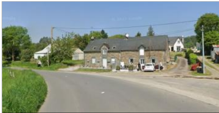
Le Passage à La Gacilly

Coordonnées WGS84 : X: -2.11687883 / Y: 47.72845520