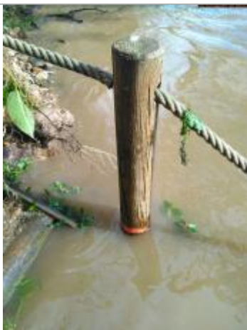
Vue du repère en 2025