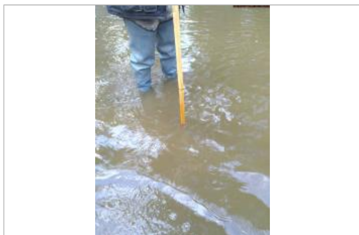
Vue du repère en 2025