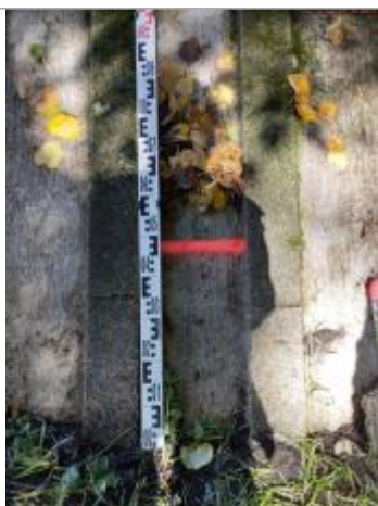
Vue du repère en 2025

Altitude calculée de l'eau (en m) : 356.472 m