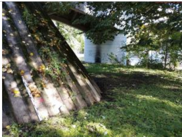
Vue du site en 2025

Coordonnées WGS84 : X: 4.24455700 / Y: 45.58371000