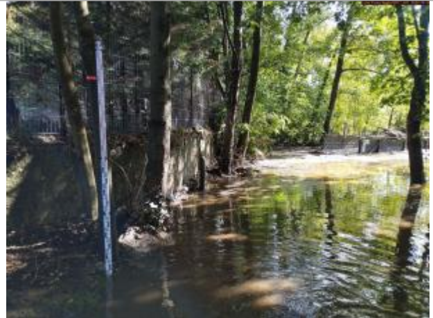
Vue du site en 2025

Coordonnées WGS84 : X: 4.24524200 / Y: 45.52826100