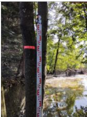
Vue du repère en 2025

Altitude calculée de l'eau (en m) : 364.013 m