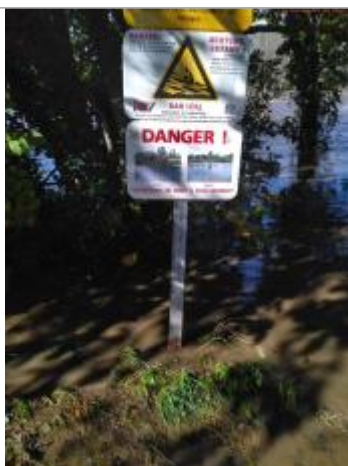
Vue du repère en 2025