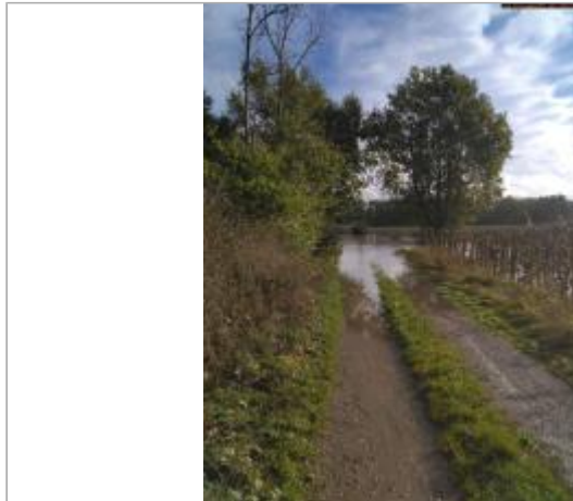
Vue du site en 2025

Coordonnées WGS84 : X: 4.21786600 / Y: 45.63489500