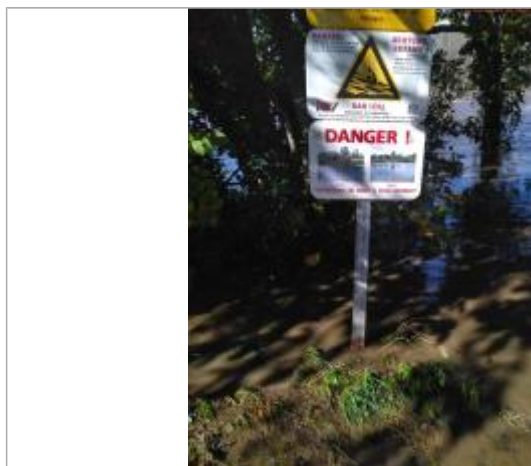
Vue du repère en 2025