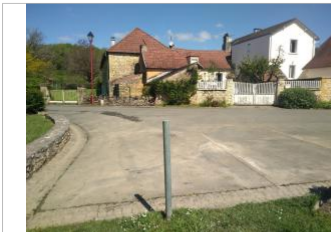
Vue du site - auteur : SMBI