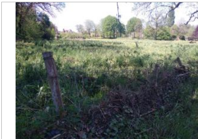
Vue du site - auteur : SMBI

Coordonnées WGS84 : X: 1.03505750 / Y: 45.32380080