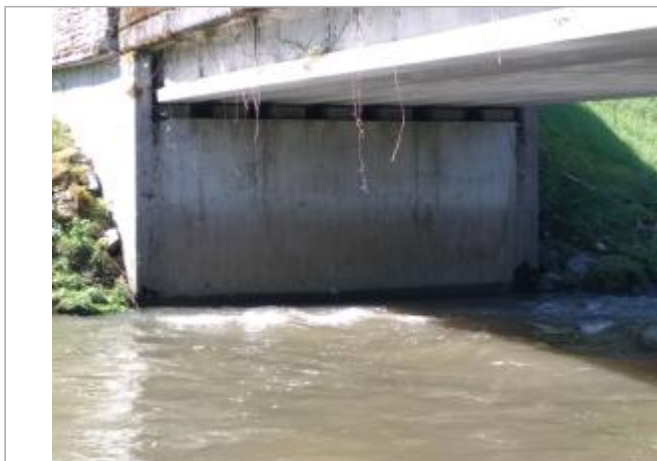
Vue du site - auteur : SMBI