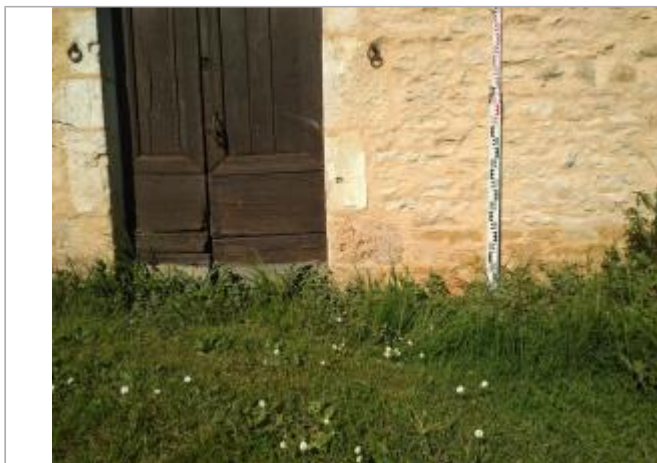
Vue du site - auteur : SMBI

Coordonnées WGS84 : X: 0.98039310 / Y: 45.30620170