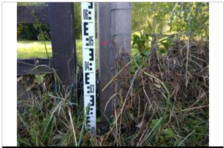
Vue de la lisse - auteur : SMBI

SOURCE DE REPÉRAGE : RELEVÉS DE LAISSES DE LA CRUE D'AVRIL 2025 SUR LA LOUE - 25/04/2025 Type de repérage : Campagne de terrain post-inondation Organisme(s) : Syndicat mixte du bassin de l'Isle