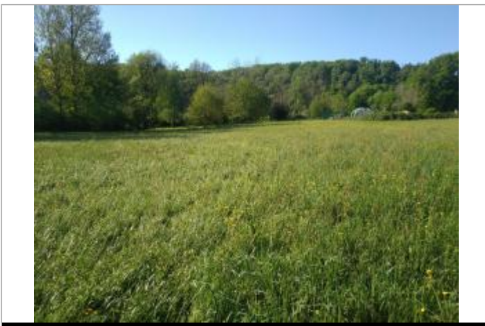
Vue du site - auteur : SMBI

GÉOLOCALISATION Coordonnées WGS84 : X: 0.98099520 / Y: 45.30504950 Coordonnées RGF93 (Lambert 93) X: 541787.18 / Y: 6469320.78 Coordonnées RGF93 (ETRS89) : X: 0.9809952 / Y: 45.3050495 Code Hydro: P61-0400 Rive de référence: Droite