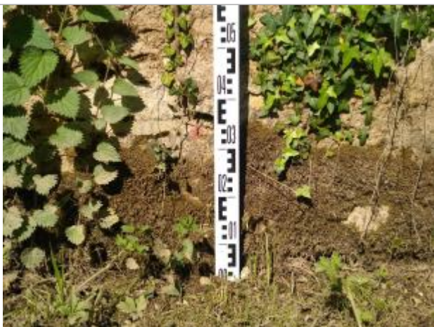
Vue de la laisse - auteur : SMBI

Différence entre le niveau d'eau et la référence (en m) : 0.350 m