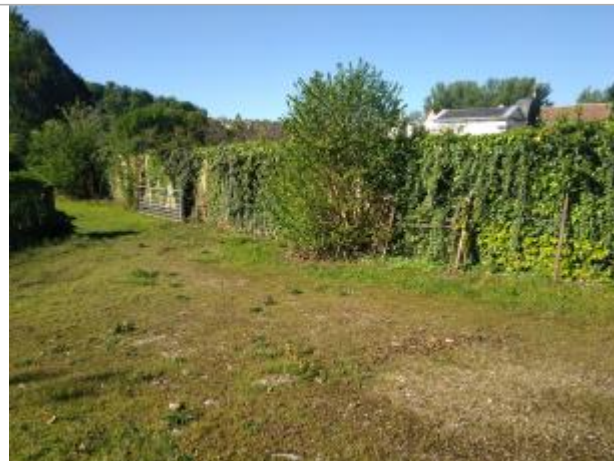
Vue du site - auteur : SMBI