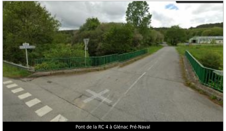
Pont de la RC 4 à Glénac Pré-Naval