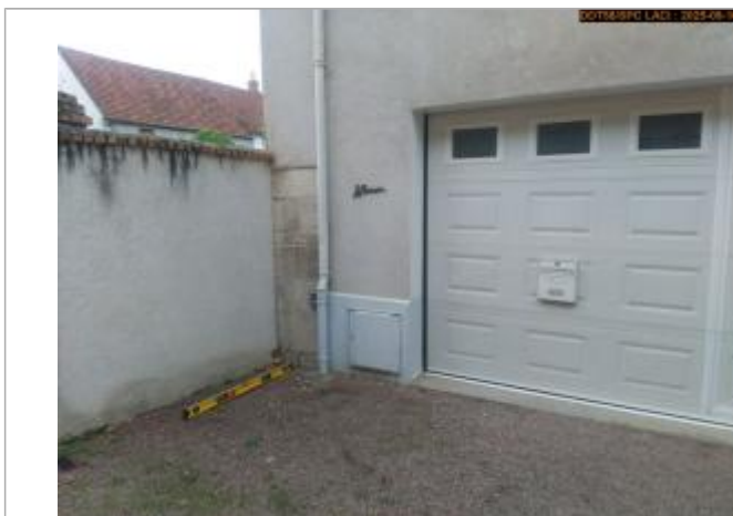
Vue du repère en 2025

Altitude calculée de l'eau (en m) : 156.342 m