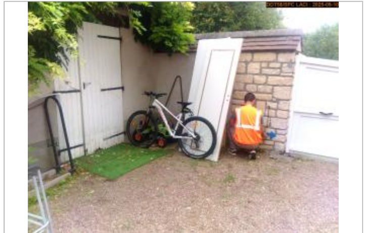
Vue du site en 2025

Coordonnées WGS84 : X: 2.99280300 / Y: 47.24413000