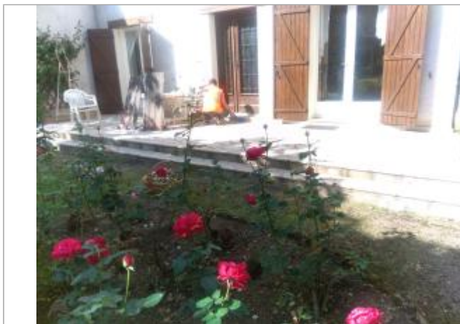
Vue du site en 2025

Coordonnées WGS84 : X: 3.06914800 / Y: 47.23817100