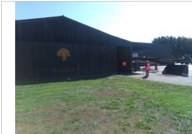
Vue du site en 2025

Coordonnées WGS84 : X: 3.18041300 / Y: 47.20348000