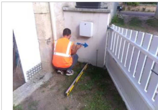
Vue du repère en 2025

SOURCE DE REPÉRAGE : SPC LACI ET DDT58, LE MAZOU, CRUE JUIN 2024 - 09/09/2025