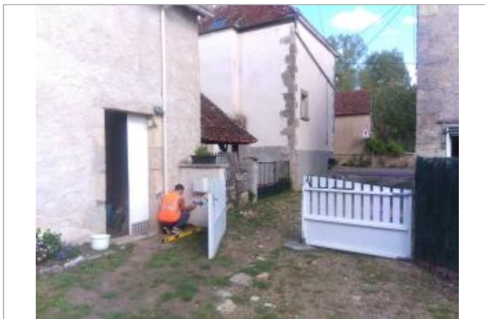
Vue du site en 2025