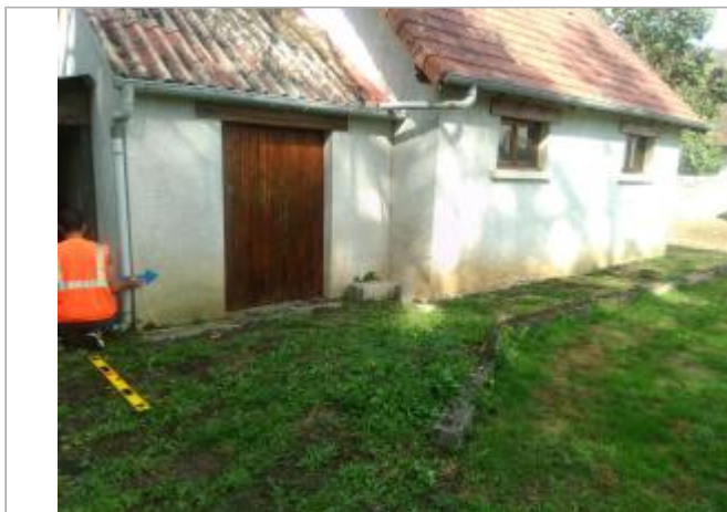
Vue du site en 2025

Coordonnées WGS84 : X: 3.06883000 / Y: 47.23834400