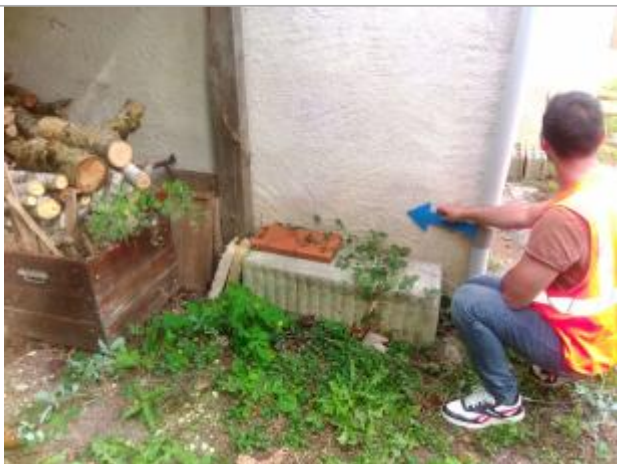
Vue du repère en 2025

Altitude calculée de l'eau (en m) : 168.185