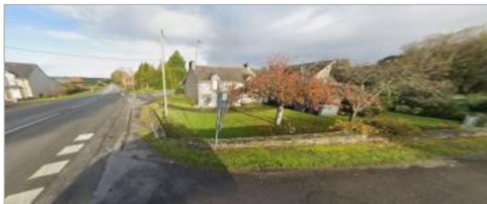
Croisement de route Lestun à Cournon