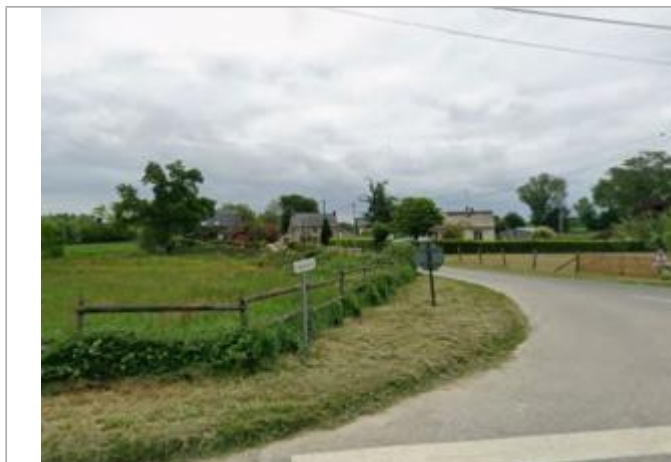
Accès au site du Moulin de Sixt