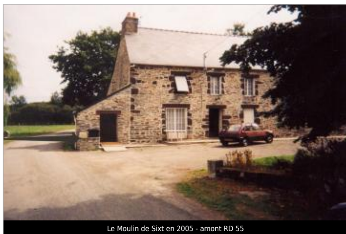
Le Moulin de Sixt en 2005 - amont RD 55

SOURCE DE REPÉRAGE : EPTB VILAINE - 02/04/2001