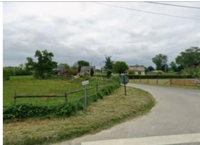
Accès au site du Moulin de Sixt