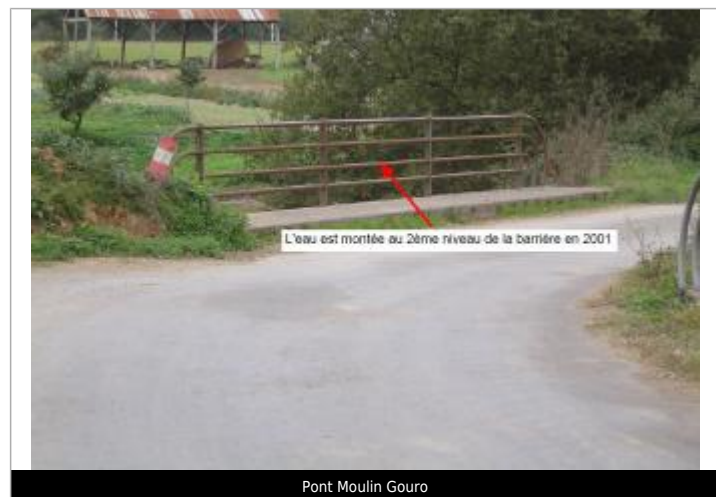
Pont Moulin Gouro