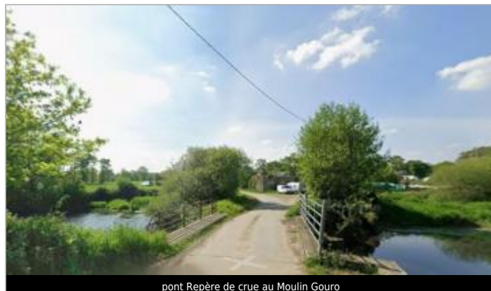
pont Repère de crue au Moulin Gouro