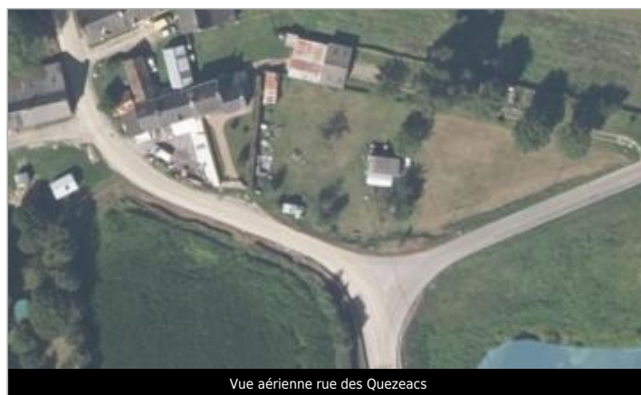
Vue aérienne rue des Quezeacs