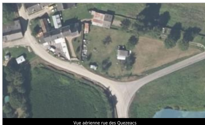
Vue aérienne rue des Quezeacs

GÉOLOCALISATION Coordonnées WGS84 : X: -2.06779160 / Y: 47.83027620 Coordonnées RGF93 (Lambert 93) X: 321096.06 / Y: 6759927.76 Coordonnées RGF93 (ETRS89) : X: -2.0677916 / Y: 47.8302762 Code Hydro: J8--0240 Rive de référence: Gauche