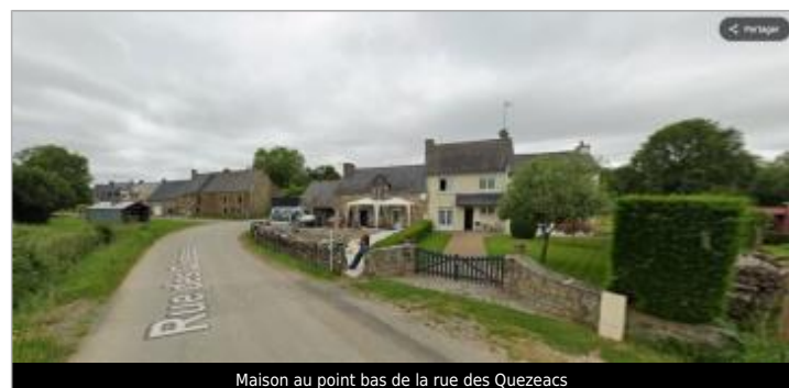
Maison au point bas de la rue des Quezeacs

MARQUE Maximum de l'inondation : Oui Visibilité : Non État du repère : Non renseigné