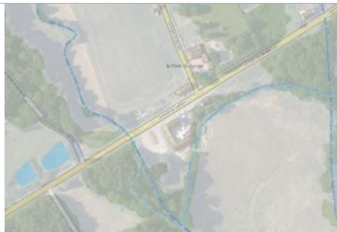
Vue aérienne lieu-dit Pont du Secret

Coordonnées WGS84 : X: -2.14189517 / Y: 47.98253590