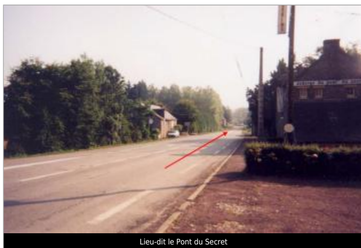
Lieu-dit le Pont du Secret

Altitude calculée de l'eau (en m) : 67.7