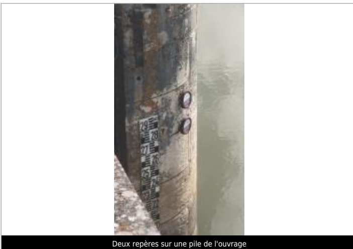
Deux repères sur une pile de l'ouvrage

GÉOLOCALISATION Coordonnées WGS84 : X: -1.01115022 / Y: 46.31695710 Coordonnées RGF93 (Lambert 93) X: 391486 / Y: 6587510 Coordonnées RGF93 (ETRS89) : X: -1.0111502 / Y: 46.3169571