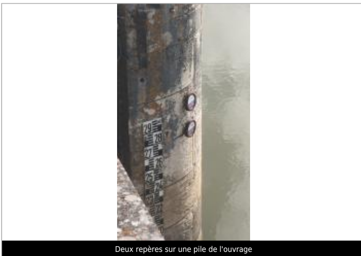
Deux repères sur une pile de l'ouvrage

GÉOLOCALISATION Coordonnées WGS84 : X: -1.01115022 / Y: 46.31695710 Coordonnées RGF93 (Lambert 93) X: 391486 / Y: 6587510 Coordonnées RGF93 (ETRS89) : X: -1.0111502 / Y: 46.3169571