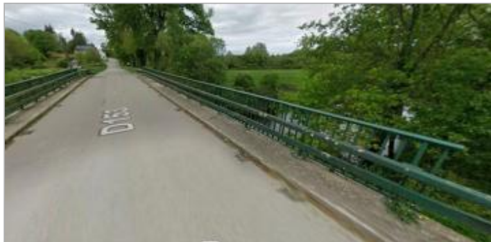
Pont sur la RD 153 au lieu-dit La Vacherie