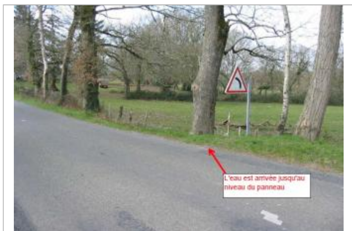
Panneau virage repère de la route inondée

Type de repérage : Campagne de terrain post-inondation