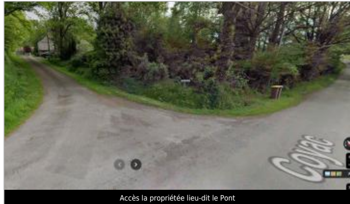
Accès la propriété lieu-dit le Pont