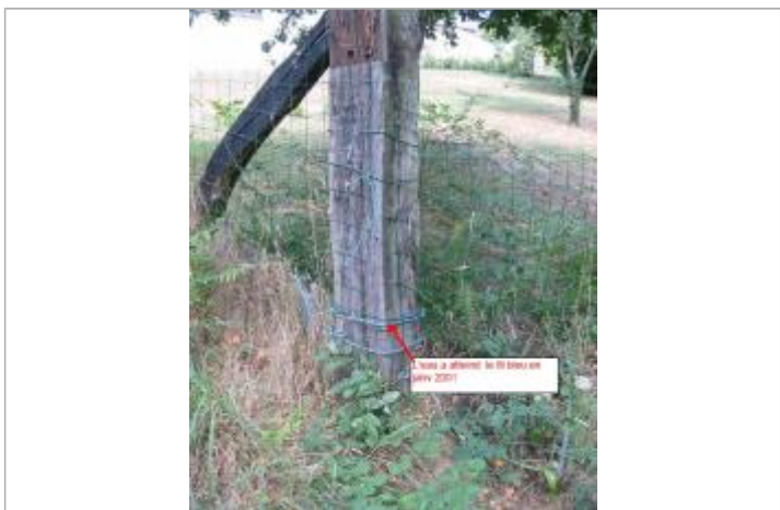
Poteau matérialisant le repère